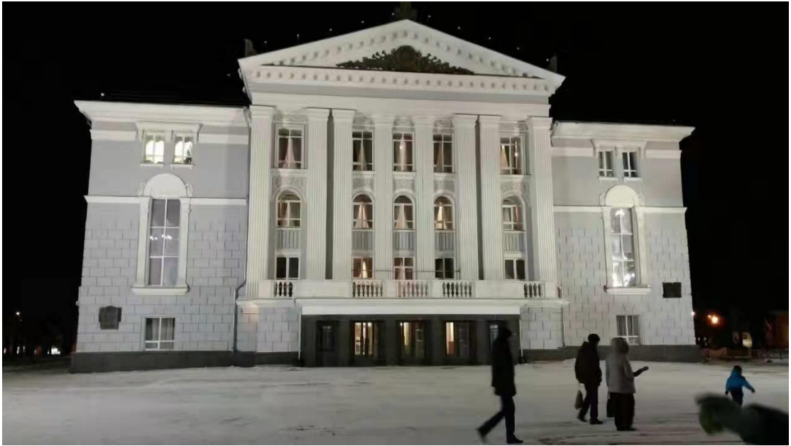
柴可夫斯基剧院夜景(学生拍的，夜晚时好像更有魅力)